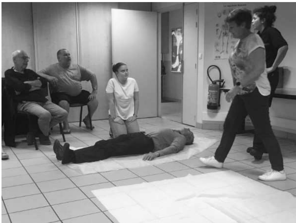
Formation premier secours