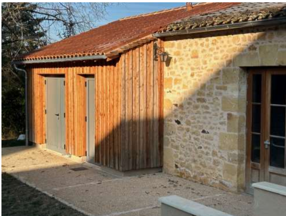
Extension salle des Fêtes