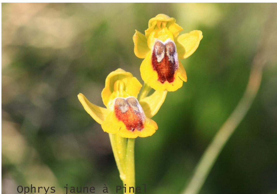
Ophrys jaune à Pineil

C'est un moment fort et émouvant pour les élèves, Anaïs, l'enseignante, les parents mais aussi pour l'ensemble du conseil municipal. Je ne doute pas, qu'à votre tour, vous serez fiers de notre école et je vous invite à réserver leur nouvelle "Sucette et Clafoutis", elle sera en vente à la bibliothèque, le bénéfice ira à la coopérative scolaire.