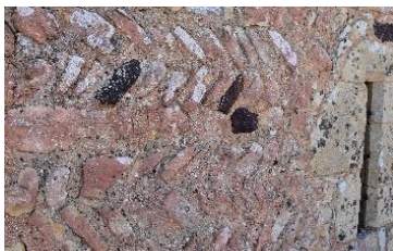
Appareil en arête de poisson

On sait que cette église est antérieure à 1153 et que la partie actuellement la plus ancienne est la nef comme l'indique son appareil « en arêtes de poissons ». En examinant le rapport entre la tour et la nef, on comprend immédiatement que cette dernière a été en partie détruite, ce que plusieurs documents attestent. A l'extérieur, les décors sont réduits au minimum (petits modillons aux bords du toit de la tour, faux claveaux dessinés sur des linteaux monolithes)