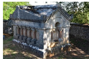
Caveau C. Lenormand (19 ème )